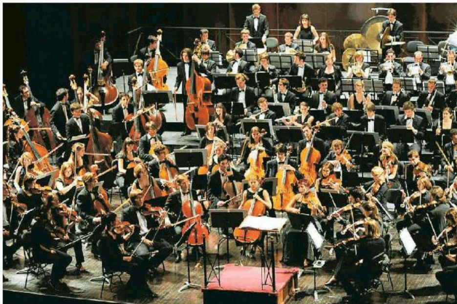
I giovani musicisti della Gustav Mahler JugendOrchester. Inizia da Aquileia il tour estivo della scuola fondata da Abbado

Prende il via il progetto di residenza promosso dal Verdi di Pordenone e diretto dal maestro Lorenzo Viotti. Primo concerto martedì