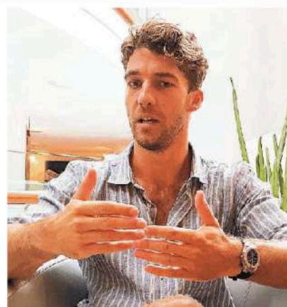
Il maestro Lorenzo Viotti in conferenza stampa.

con i Wiener Philharmonic. Contra la qualità del lavoro - spiega il maestro - è il rispetto che si guadagna sul campo. I giovani della Gmjo suonano per entusiasmo: non sono pagati mentre vivono quella che forse sarà la più bella esperienza musicale della loro vita. Hanno un forte obiettivo comune: un seme che sboccherà in futuro, nelle orchestre professionali che li ospiteranno». Da non perdere, lunedì 13, dalle 15, le prove aperte dell'Orchestra e sempre il 13, dalle 21, una magica serata, nell'ambito dell'Estate a Pordenone 2018 in collaborazione con Sviluppo e Territorio, un happening musicale itinerante in 4 location simbolo di Pordenone: il chiostro della biblioteca, l'ex convento di San Francesco, in piazza Risorgimento e all'esterno del Verdi. (Prenotazione obbligatoria: info@comunale.giuseppeverdi.it ). —