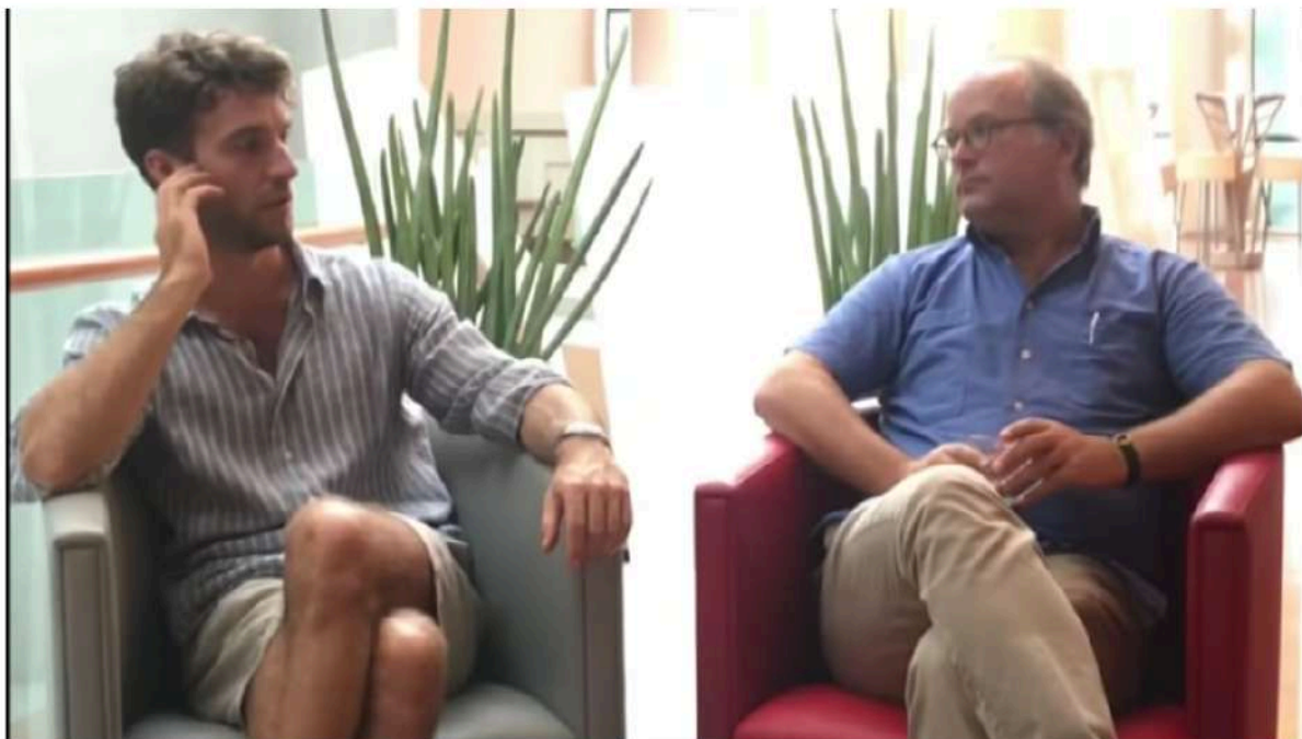
2018 08 10 tg udinews 19 00