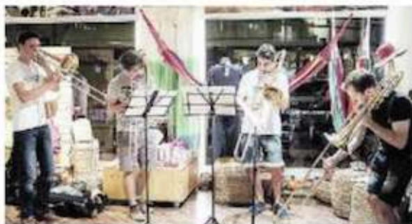
QUESTA SERA Esibizioni gratuite in centro a Pordenone

co (prenotazioni a info@comunalegiuseppeverdi.it ) mentre la sera dalle 21 è previsto un happening musicale itinerante nel centro storico di Pordenone, in quattro luoghi simbolo della città: il Chiostro della Biblioteca Civica, l'ex Convento di San Francesco, Piazza Risorgimento e lo spazio esterno del teatro Verdi. Sarà l'occasione per gustare il suono dell'Orchestra e dei suoi talentuosi musicisti attraverso concerti e performance, tutti a fruizione gratuita. Il progetto di residenza artistica della GMJO coinvolge centocinquanta musicisti giovanissimi di vari Paesi europei, impegnati in una delle più note compagini sinfoniche del mondo: vivranno a Pordenone e in Friuli Venezia Giulia un'esperienza speciale e ci guideranno a scoprire la musica nelle mille sfaccettature che può offrire. I concerti di Pordenone del 3 e 4 settembre chiuderanno il Summer Tour della GMJO in Europa: saranno eseguite due sinfonie celeberrime, la "Patetica" di Čajkovskij e la Quinta di Mahler, e i concerti per violoncello e orchestra di Shostakovich e Dvorák. Preveduta sul sito www.comunalegiuseppeverdi.it e alla biglietteria del teatro dal 20 di agosto, con speciali agevolazioni per chi acquisterà i due concerti e/o l'abbonamento musicale al cartellone 2018/2019.