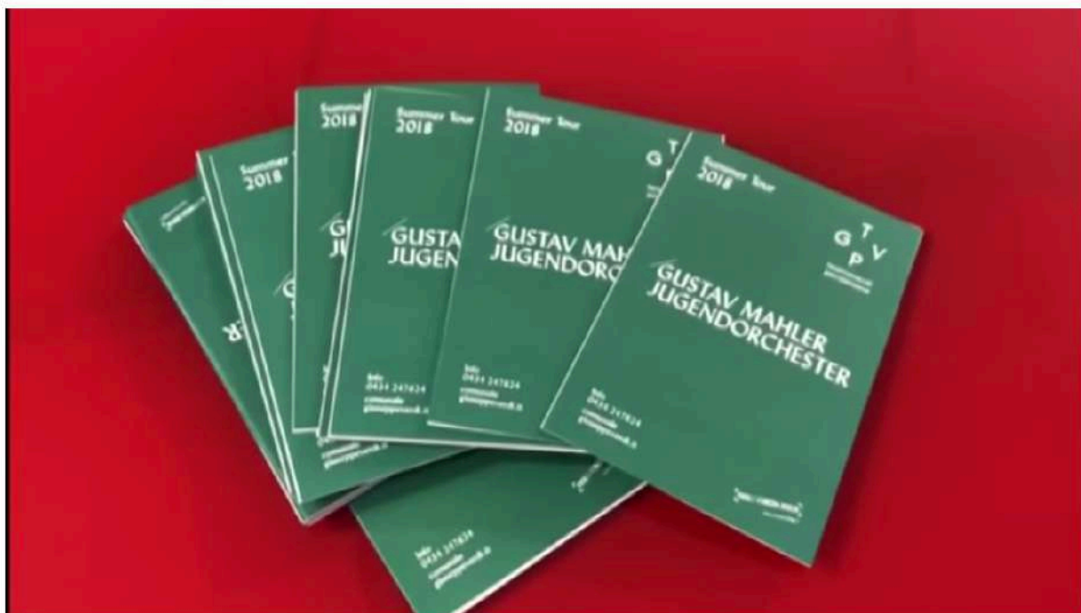
2018 08 10 tg udinews 19 00