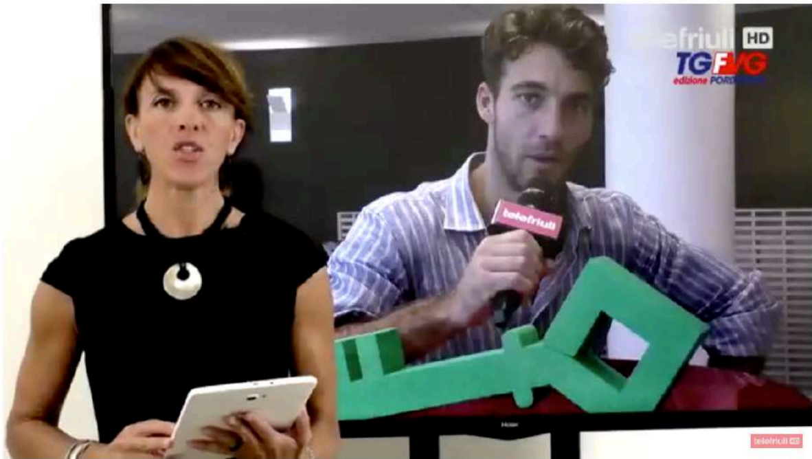
Telegiornale di Pordenone - 10 Agosto 2018