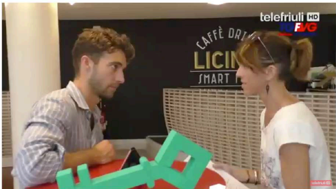
Telegiornale di Pordenone - 10 Agosto 2018