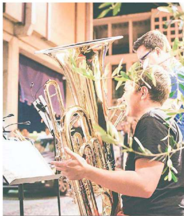
I giovani musicisti della Gustav Mahler Jugendorchester saranno protagonisti oggi di "Una sera d'estate"

Entra dunque nel vivo l'estate musicale di Pordenone con la full immersion produttiva della Gustav Mahler Jugendorchester. Un primo assaggio si avrà oggi con le prove aperte in programma al Verdi dalle 15: un appuntamento speciale per vivere da vicino le suggestioni di una grande produzione e conoscere il metodo di lavoro di un'orchestra ovunque celebrata. Prenotazioni a in-