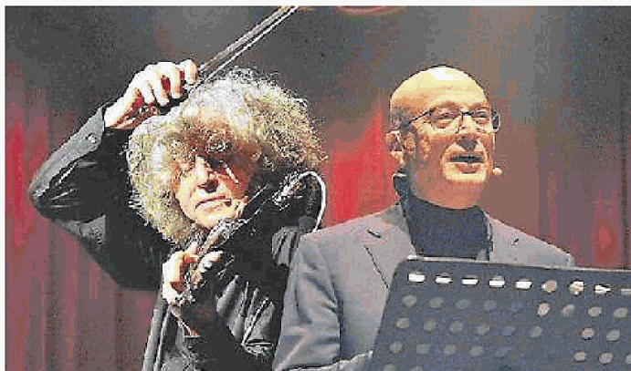
MUSICA E PAROLE Angelo Branduardi e Aldo Cazzullo