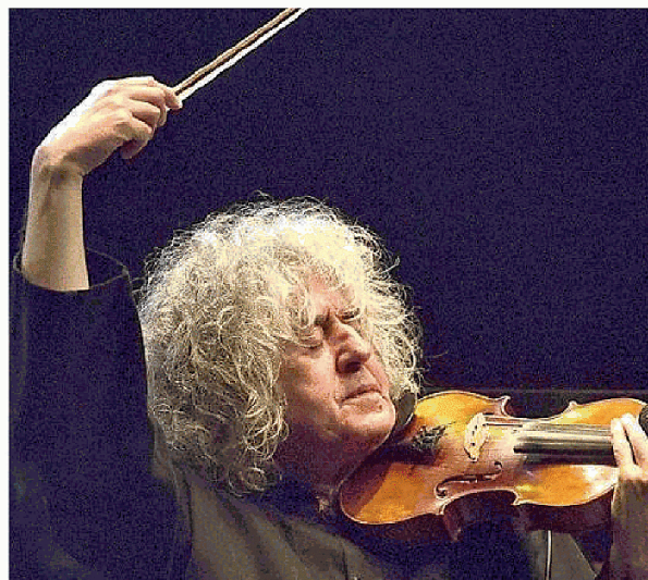
Angelo Branduardi sarà domenica pomeriggio a Pordenone

Appuntamento domenica pomeriggio al Verdi di Pordenone L'omaggio a San Francesco per gli 800 anni della morte