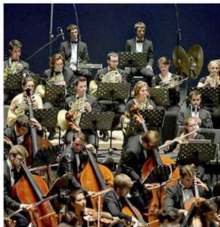
LA GRANDE MUSICA IL TEATRO OSPITA LA RESIDENZA DELLA GUSTAV MAHLER JUGENDORCHESTER

Per capire questa piccola rivoluzione bisogna partire dagli inizi. «Ho ereditato un'associazione culturale, l'ex Associazione per la prosa, che gestiva dei locali» spiega. «Faceva il cartellone: io, che venivo da Cinemazero, ero sorpreso. La mia era una realtà che invece era già aperta ai territori, a collaborazioni, alle sperimentazioni». A pesare, sottolinea, c'è anche l'esperienza in banca. «Una banca che prima era stata aggregata, poi aggregata: siamo sempre stati spinti a fare attività particolari, come mostre d'arte al piano terra del palazzo Cossetti». Quando arriva al Verdi Lessio porta il suo background. «La rivoluzione, tra virgolette, che c'è stata a livello di mentalità è stata quella di passare dall'idea di un'associazione culturale che gestiva uno spazio a quello di un'impresa che doveva fruttare un investimento pubblico di qualche decina di milioni di