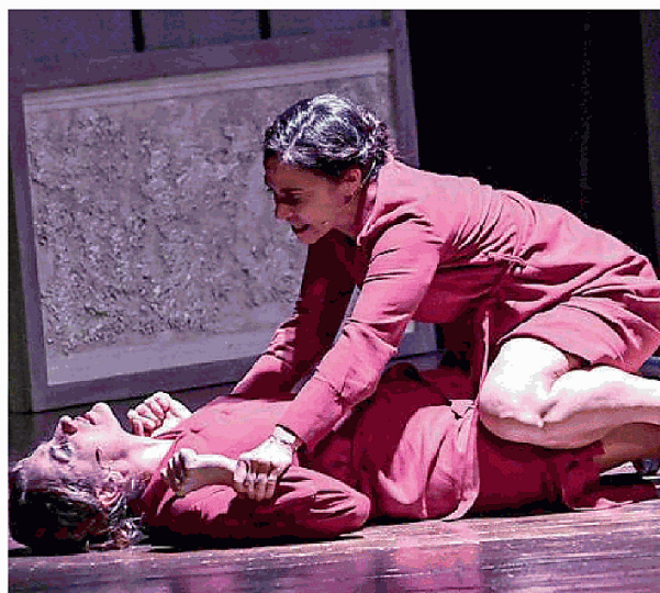
Una scena dello spettacolo L'assaggiatrice di Hitler