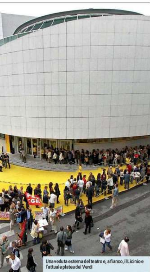
Una veduta esterna del teatro e, a fianco, il Licinio e l'attuale platea del Verdi