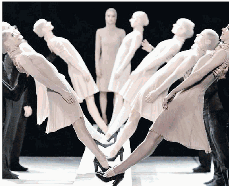
CARMINA BURANA Coreografie sulle musiche immortali di Carl Orff al Teatro Verdi di Pordenone