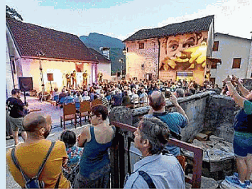
Uno spettacolo del Teatro Verdi ad Andreis

siano delle visite guidate, che ci sia la presentazione di prodotti, che ci sia modo per chi viene allo spettacolo di conoscere meglio il luogo, chi ci abita e anche i problemi che hanno. Il progetto ogni anno viene sempre più capito da queste comunità: ormai siamo veramente tirati per la giacca. Credo che il bello di tutto questo progetto, al di là dell'aspetto qualitativo dato dagli incontri, sia proprio questo rapporto diretto con le persone e con le comunità che ne traggono an-