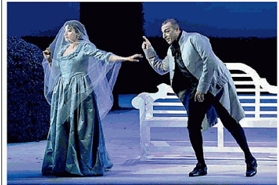
Tre scene delle Nozze di Figaro, in arrivo a Pordenone

gia anche il paggio Cherubino, adolescente perennemente innamorato che esaspera a suo modo la gelosia del Conte; mentre un inaspettato riconoscimento rivelerà che la vecchia Marcellina è in realtà la madre di Figaro, risolvendo un intricato contenzioso legale, la trappola definitiva scatterà di notte nel giardino.