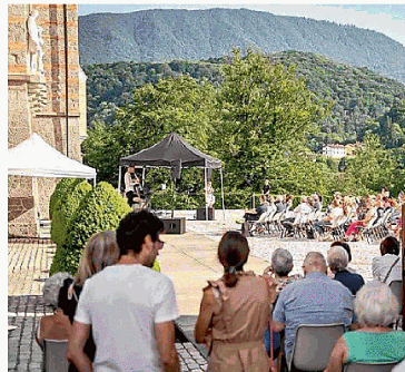
Cultura e scienza si fondono negli appuntamenti proposti in trasferta dal Teatro Verdi di Pordenone

Con l'iniziativa si è voluto innescare un nuovo patto tra città e valli superando una visione da lontano e stereotipata