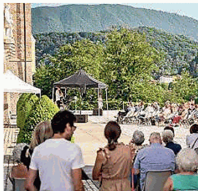
Un'iniziativa del Teatro Verdi