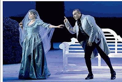
Tre scene delle Nozze di Figaro , in arrivo a Pordenone

gia anche il paggio Cherubino, adolescente perennemente innamorato che esaspera a suo modo la gelosia del Conte; mentre un inaspettato riconoscimento rivelerà che la vecchia Marcellina è in realtà la madre di Figaro, risolvendo un intricato contenzioso legale, la trappola definitiva scatterà di notte nel giardino. Grazie a uno scambio d'abiti tra Susanna e la Contessa, il Conte verrà colto in flagrante mentre corteggia la propria moglie: smascherato davanti a tutti, il nobile implorerà il perdono di Rosina prima del gran finale, con la riconciliazione generale e il trionfo dell'astuzia e dell'amore autentico sul privilegio di casta.